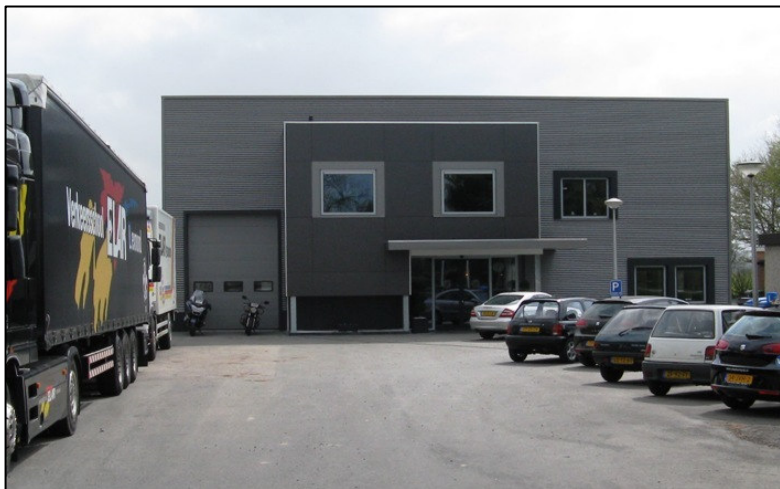
Met een andere voorgevel huist hier tegenwoordig Elar Autorijschool.