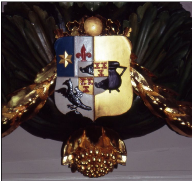
Het wapenschild onder de middelste pijpenkoker van het orgel.