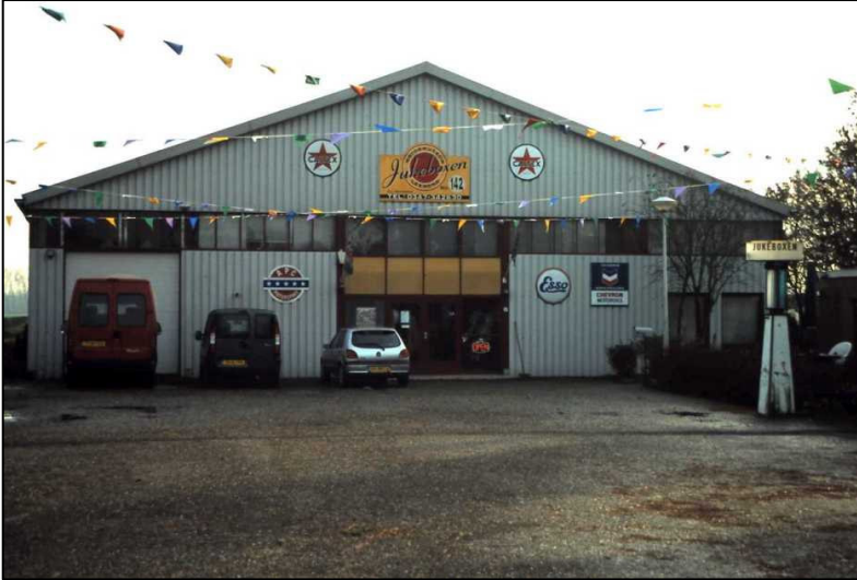
Het enige museum dat Lexmond ooit had: Motormuseum Lexmond.