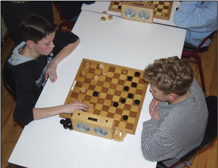
De foto toont aan dat er nog steeds jongeren zijn die van dammen houden.

Er zijn gelukkig hier en daar nog actieve damclubs die goed draaien, maar niet meer in Hei- en Boeicop en Lexmond. De schrijver van dit stukje denkt met veel plezier terug aan zijn periode in Hei- en Boeicop en aan de tijd dat hij lid was bij HBDV. Hij is de enige Hei- en Boeicopper die nog actief dammer is bij een damclub.