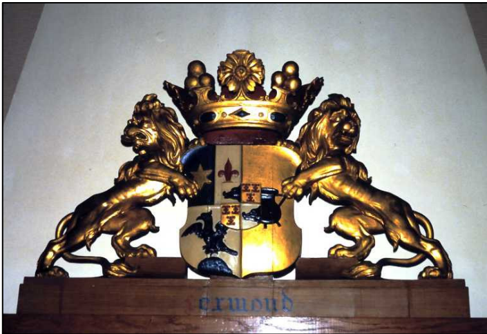
Het wapenbord in de oude raadzaal.

Op de schoorsteen van de raadzaal in het oude gemeentehuis aan de Dorpsstraat te Lexmond, nu in gebruik als trouwzaal, stonden vroeger enkele voorwerpen. Het meest opvallende was het houten wapenschild. Dit is het enige dat er tot op de huidige dag nog staat.