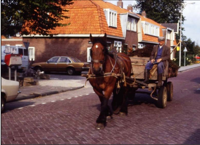
Gijs de Ruiter met paard en wagen in 1979.