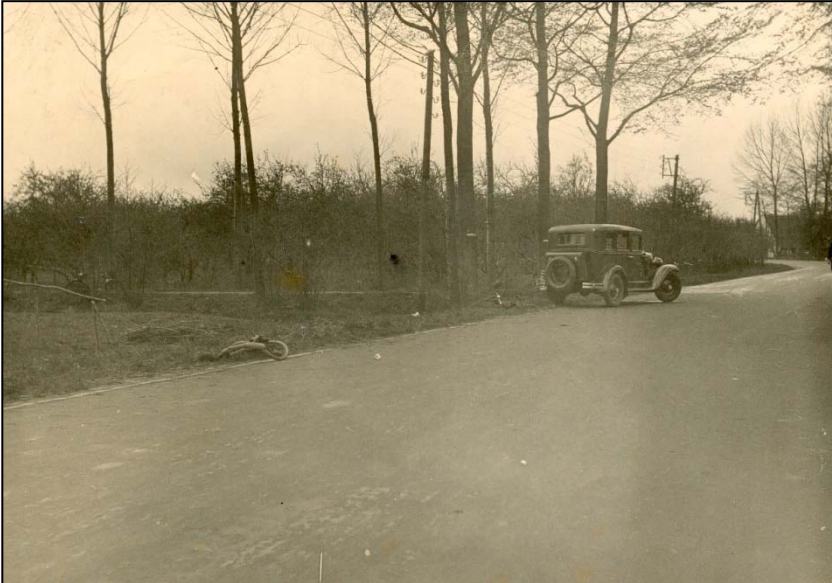
Geheel links van de weg staat de personenauto en liggen de twee vernielde fietsen op de grond.