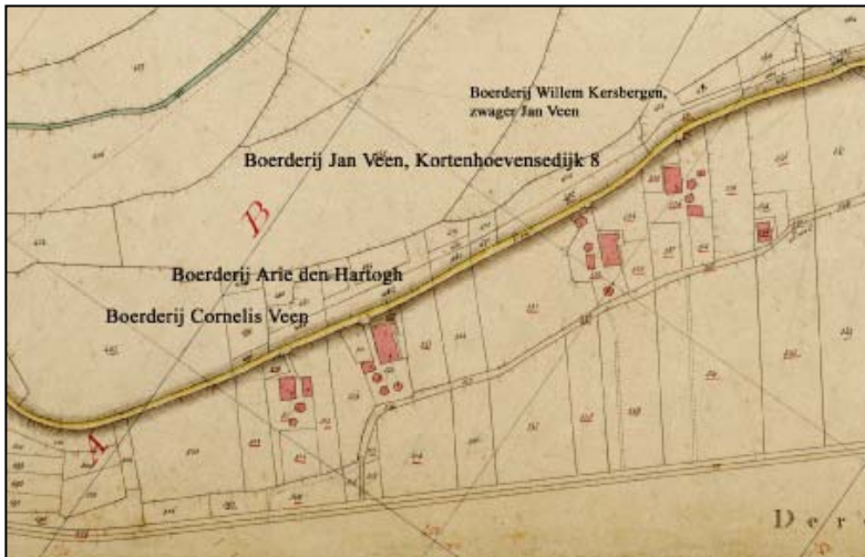
Kortenhoevendijk Lexmond 1832