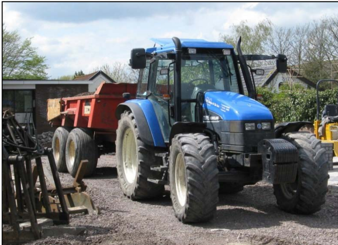
Zware tractoren met dito wagens zijn daarvoor in de plaats gekomen (2012).