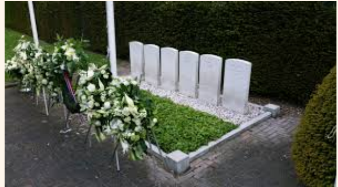
De oorlogsgraven in Hei- en Boeicop.

De Vereniging Historisch Lexmond en Hei- en Boeicop brengt op 1 mei, in het kader van 75 jaar Bevrijding, een boekje uit over de oorlogsjaren in Hei- en Boeicop. Om deze uitgave compleet te maken, zijn wij op zoek naar foto's, voorwerpen, documenten en andere herinneringen aan gebeurtenissen in Hei- en Boeicop tijdens de Tweede Wereldoorlog. Heel graag tekenen we ook persoonlijke verhalen op. In het bijzonder zijn we op zoek naar informatie over de in Heicop neergestorte vliegtuigen, zoals de Lancaster die in Neder Heicop terechtkwam. De overleden vliegeniers liggen op de begraafplaats in het dorp. Alle informatie is van harte welkom. We gaan uiterst zorgvuldig met uw foto's en voorwerpen om.