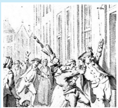
Patriotten vechten met prinsgezinden in Oudewater.

Waar: Historium, Kortenhoeveneseweg 28 in Lexmond