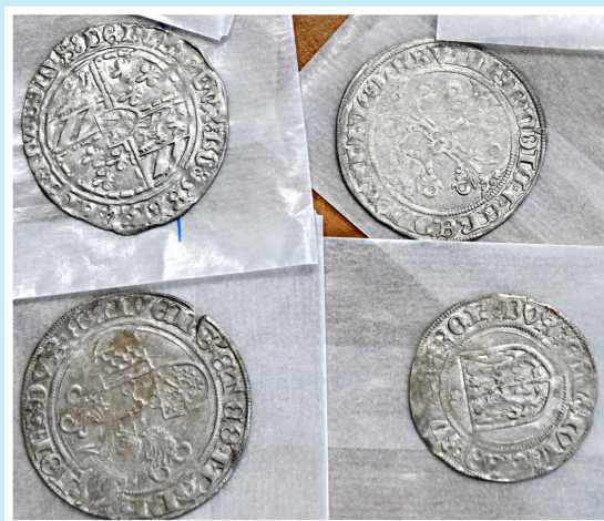
Enkele munten die in Hagestein zijn gevonden.

In het Stedelijk Museum Vianen is sinds kort de 'Muntschat Hagestein' te zien. Tijdens bouwwerkzaamheden in het nieuwe dorp Hoef en Haag bij Hagestein deden medewerkers van waterleidingbedrijf Oasen in 2017 een bijzondere archeologische vondst. Zij groeven vijfhonderd middeleeuwse gouden en zilveren munten op. Een deel daarvan is te zien in de expositie. De munten komen uit de tweede helft van de vijftiende eeuw, een periode van grote sociale onrust als gevolg van een conflict tussen de Utrechtse bisschop David van Bourgondië en Utrechtse edellieden. Dat conflict resulteerde in de Stichtse Oorlog van 1481-1483. In die jaren zijn de munten begraven in een kookpotje. De meeste exemplaren zijn nauwelijks gebruikt en verkeren in 'uitzonderlijk goede staat'. Ook zit er een aantal zeer zeldzame munten tussen, zoals een unieke munt uit Leeuwarden, een gouden munt van koning Henry VI van Engeland, een Salut d'Or geslagen in Parijs en munten van bisschoppen en pausen.