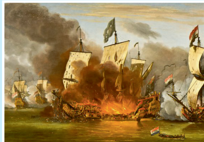
Zeeslag bij Solebay.

Veel kijkers (zo'n 900.000) en lovende kritieken voor de NPO-docuserie over het Rampjaar 1672. Onder redactie van het historische programma Andere Tijden is dit najaar een zevendelige docuserie gestart over het rampjaar. De uitzendingen zijn te zien op vrijdagavond op NPO 2. Wie de eerste afleveringen heeft gemist, kan die uiteraard nog terugkijken.