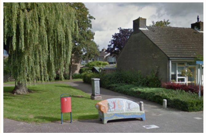
Het bankje op zijn oude locatie, op de hoek van de Berkenlaan en Lijsterbeslaan in Lexmond.

Het kleurige mozaïekbankje dat tot voor kort op de hoek van de Berkenlaan en Lijsterbeslaan in Lexmond stond, heeft een nieuwe plek gekregen. Op verzoek van de gemeente Vijfheerenlanden heeft de VHLHB zich erover ontfermd. Het staat nu achter het verenigingsgebouw Historium en kan dienst doen als rustpunt voor bezoekers van de begraafplaats. Het bankje is een ontwerp van de buurtbewoners, die daarmee een prijs wonnen. Wel is het nu licht beschadigd. We zijn daarom op zoek naar vrijwilligers die het mozaïekwerk zouden willen herstellen.