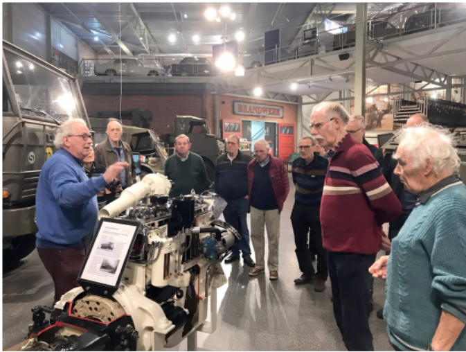
Rondleiding door het uitgebreide DAF-Museum.