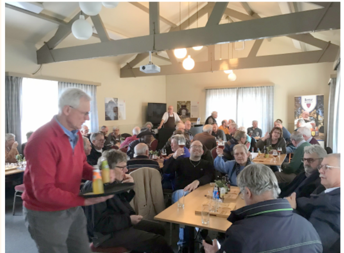
Bier en andere drankjes proeven in Abdij Berne.