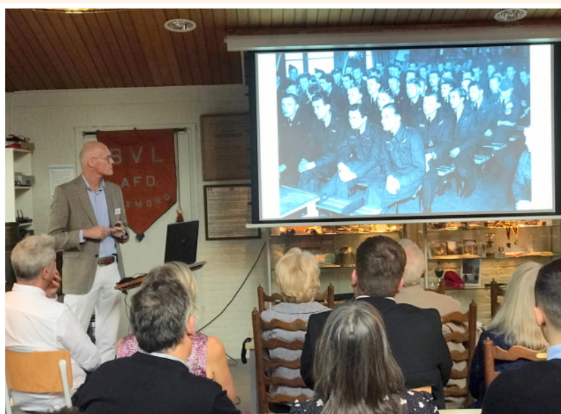
Nabestaanden van de omgekomen bemanningsleden luisteren geconcentreerd naar de presentatie van Rob van Putten over de neergestorte Lancaster en haar bemanning. De lezing wordt, in iets gewijzigde vorm, op 3 mei herhaald in Hei- en Boeicop.

In de nacht van maandag 22 op dinsdag 23 augustus 1943 stortte in Hei- en Boeicop een Lancaster van de Royal Air Force brandend neer. De geallieerde bommenwerper kwam terug van een missie naar Duitsland. Een nachtjager haalde het vliegtuig neer. Zes van de zeven bemanningsleden kwamen om het leven en werden in het dorp begraven. Eén vlieger werd krijgsgevangen gemaakt.